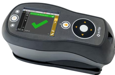
便携式分光光度仪 Ci64