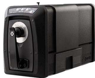
台式成像分光光度仪 Ci7800